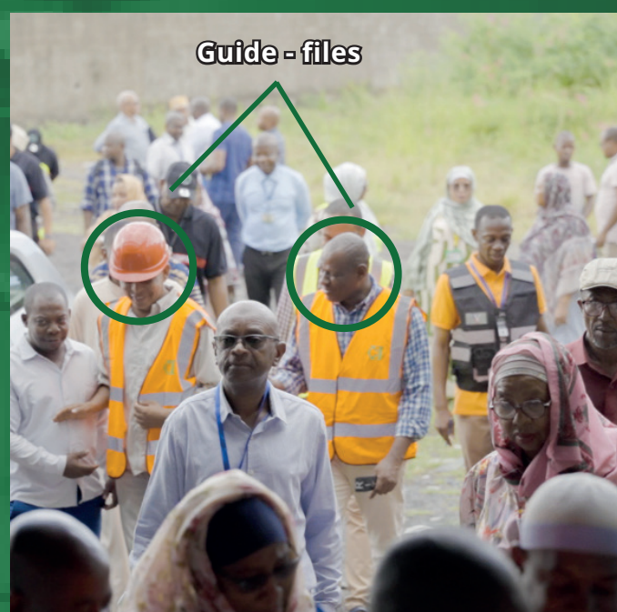
Guide - files

Cette démarche proactive s'inscrit dans la responsabilisation des employés tout en s'alignant sur les bonnes pratiques de sécurité.