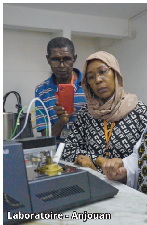
Laboratoire - Anjouan