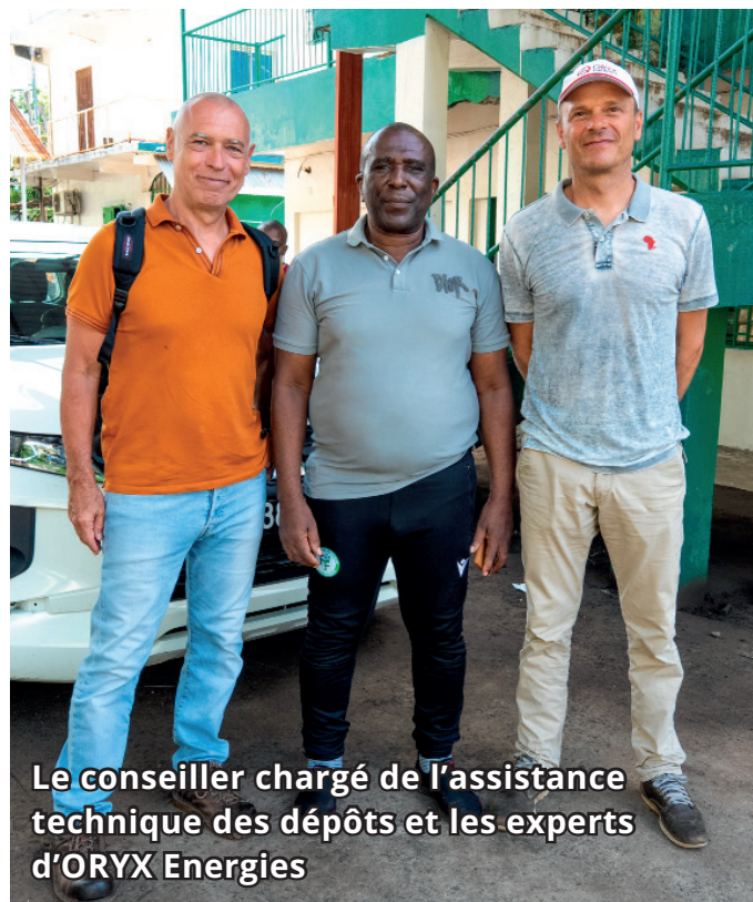
Le conseiller chargé de l'assistance technique des dépôts et les experts d'ORYX Energies

À l'issue de la mission, les experts d'Oryx Energies ont restitué leurs travaux à la Direction Générale. Cette restitution a permis de partager un diagnostic précis de la situation et de présenter différentes options d'intervention, ouvrant la voie à des décisions stratégiques pour renforcer durablement les capacités de la SCH à Anjouan.